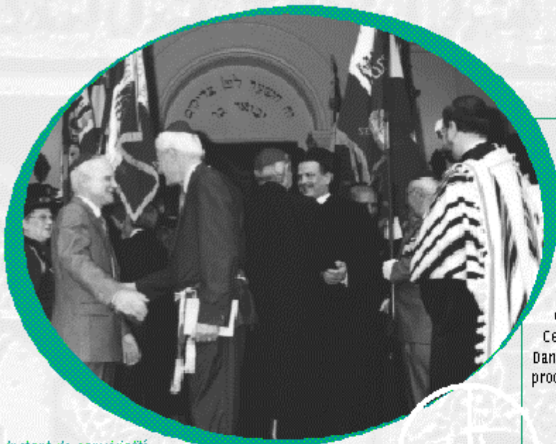
Instant de convivialité entre le Maire, le Rabbin, l'Evêque, et l'Imam qui viennent de commémorer le souvenir des déportés

culturelle. Et à quel point cela pèse sur les plus jeunes, qui se savent particulièrement touchés par le chômage et pour certains d'entre eux dans la quasi incapacité d'accéder à un premier emploi.